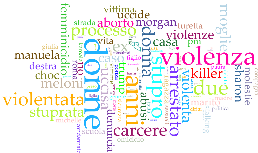
Graf. 4 - RIFLETTORI SU DI LEI

Elaborazione Osservatorio STEP ROMA - Le parole giuste, 10 novembre 2024